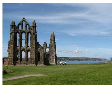
Whitby Abbey (sehr sehenswert)