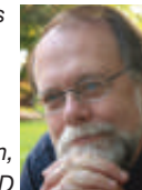
O. Fred Donaldson, PhD

Mo. 20. Nov. 2017, 14:00 bis 18:00 Di. 21. Nov. 2017, 14:00 bis 18:00 Mi. 22. Nov. 2017, 8:30 bis 12:30