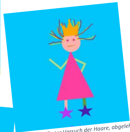
Abbildung 2: Erster Versuch der Haare, abgelehnt vom Gremium der Schulanfängerinnen.