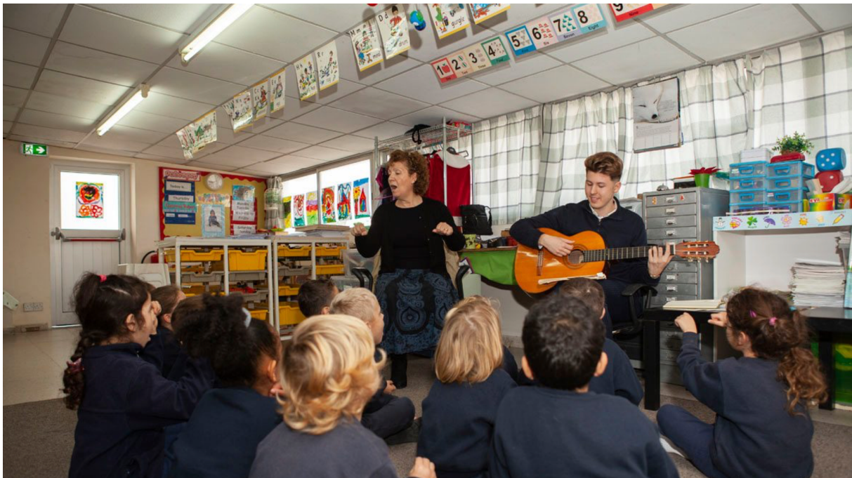
Abbildung 1: Beim Musizieren im Kindergarten

In diesem Praktikum in einer christlichen, englischsprachigen Schule auf der Insel Zypern waren die meisten meiner Tätigkeiten auf meinen Schwerpunkt ausgerichtet (Musik, Theater & Medien). Aus diesem Grund verbrachte ich in der Schule viel Zeit in den Klassen mit theaterpädagogischen Spielen (in englischer Sprache), die ich selbst mit den Kindern durchführte und auch im Medienunterricht („IT-lesson“), bzw. den Musikstunden, bei welchen ich mehr als Beobachter und Assistent anwesend war (Hospitation).